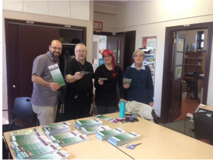
On est prêt pour le Salon du 21 octobre! Les outils de renseignements sont à jour.

Les membres de la Table Concertation Habitation Beauport ont reçu une bonne nouvelle au début février 2017. Notre projet de salon sur le logement social et communautaire à Beauport, déposé dans le cadre du Programme d'aide aux organismes communautaires, volet « soutien aux projets ponctuels » de la Société d'habitation du Québec, a été retenu. Cette aide financière, ajoutée aux contributions de l'arrondissement de Beauport, des Promenades Beauport, de la CDCB et de Proludik nous permettra donc de lancer officiellement notre 1er salon beauportois du logement social et communautaire qui se déroulera samedi le 21 octobre 2017 aux Promenades Beauport de 9h à 17h . La programmation complète devrait être connue à la rentrée de l'automne mais nous pouvons tout de suite dire qu'il y aura des exposants, un espace jeunesse avec jeu gonflable et des prix à gagner. Vous aurez accès à une panoplie de renseignements pour vous aider à mieux vous y retrouver dans le monde du logement social et communautaire. Après tout, les logements sociaux et communautaires c'est pour tout le monde!