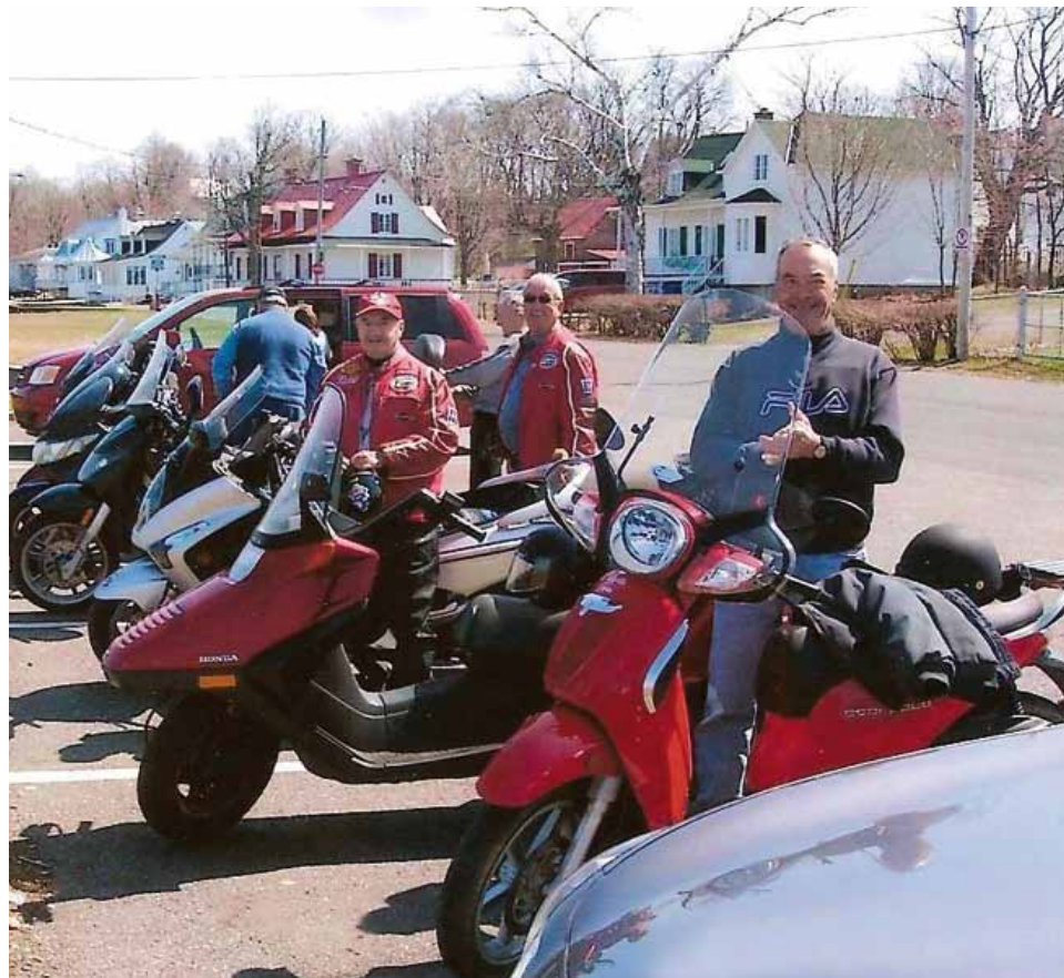
Quelques membres du Club en randonnée.