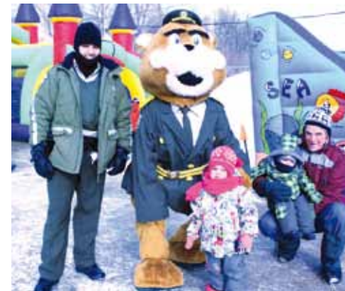
La mascotte de la Sureté du Québec « poulixe » était présente à la fête afin d'assurer la sécurité.