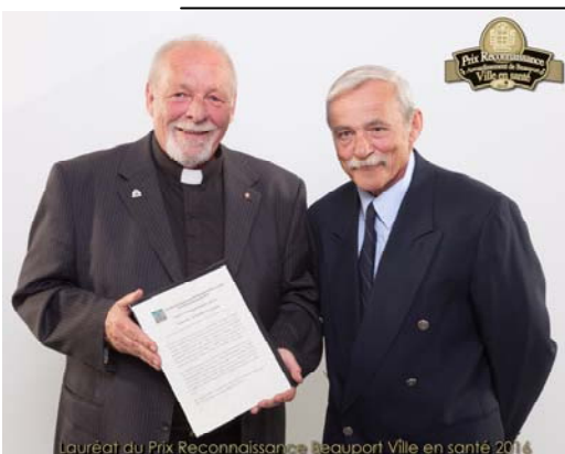
Lauréat du Prix Reconnaissance Beauport Ville en santé 2016