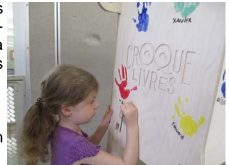
Croque-Livres à Matinée Frimousses