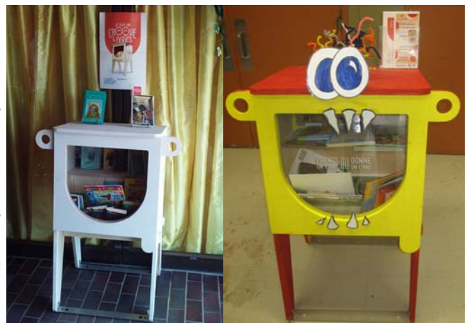
Croque-Livres Entraide Agapè Booquino, Croque-Livres situé au Centre communautaire des Chutes